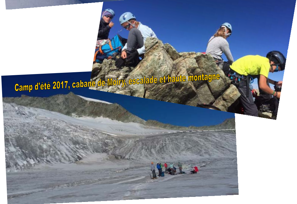
Camp d'été 2017, cabane de Moiry, escalade et haute montagne