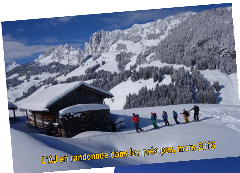
L'AJ en randonnée dans les préalpes, mars 2016