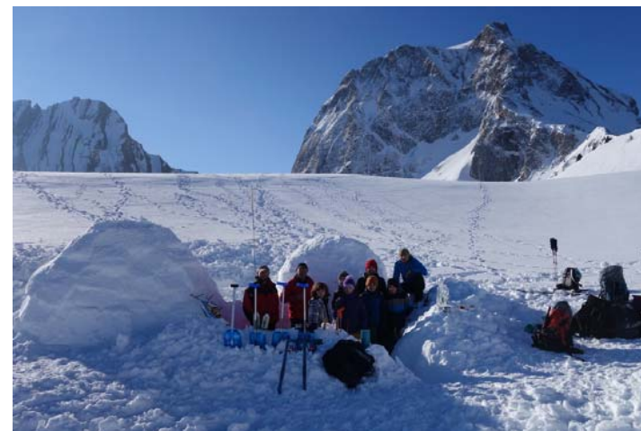
Nuit sous Igloo avec l'AJ en mars 2016